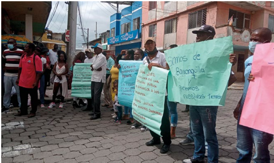
1.6 Protesta de la comunidad en el juzgado de San Lorenzo

La comunidad de Barranquilla de San Javier está ubicada en el cantón de San Lorenzo, Provincia de Esmeraldas. Se constituyó como comuna en el año 2000, con un título de propiedad comunal entregado por el INDA, amparado en la Ley de Comunas, en los derechos colectivos reconocidos en nuestra Constitución y en el convenio 169 de la OIT, y por supuesto, mediante la lucha comunitaria.