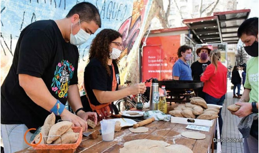
6.3 El pan de la resistencia