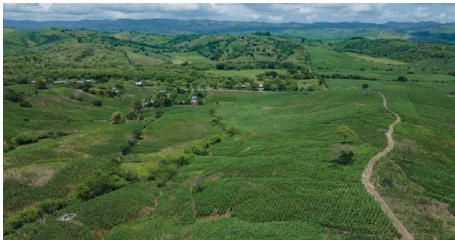
2.4 Zonas maiceras en funcas campesinas - Manabí

Este es el caso del maíz híbrido y de alto rendimiento en el Ecuador. Aunque, el Ecuador no es el centro de origen de maíz, sí es un centro de diversidad de este cultivo. Las evidencias arqueológicas indican que en el sitio Las Vegas, en la Costa Sur del Ecuador, se cultivaba maíz hace 7170 años Marcos (2005).