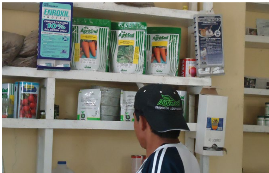
2.1 Venta de semillas en zona hortícola de Azuay

Un importante porcentaje de la producción hortícola en el Ecuador está en manos de pequeños campesinos que cuentan con muy poca superficie de tierra, donde hacen una producción intensiva en mano de obra y en insumos. Esta forma de cultivo da a las familias campesinas de tener una vida digna con poca tierra, al tiempo que proveen a la población de alimentos de buena calidad, pues la mayor parte de su producción está destinada a la venta de excedentes a mercados locales y nacionales.