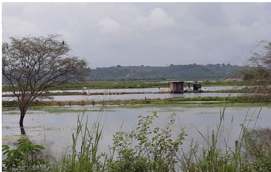
1.4 Camaronera en tierras campesinas.

Una pequeña camaronera puede necesitar cientos de miles de alevines para cada ciclo de siembra. Sus proveedores suelen ser los laboratorios que existen en la zona, o los larveros que recolectan la larva en el manglar, poniendo en peligro a otras especies acuícolas (Fenucci, 2006).