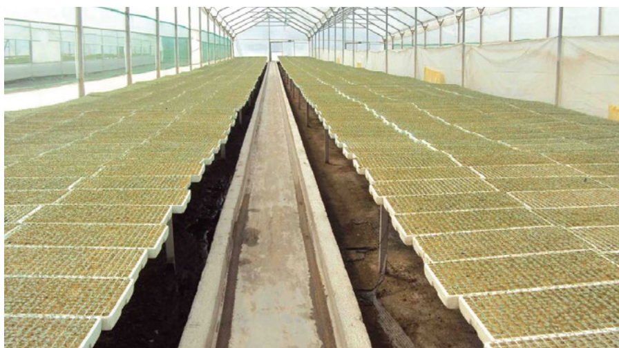
2.2 Almacigos para la producción de brócoli a gran escala

Para enfrenar la problemática presentada aquí, es urgente el desarrollo de políticas públicas, tanto a nivel de los centros de investigación públicos para que el país pueda producir sus propias semillas, del gobierno central para que fomente políticas encaminadas a alcanzar este objetivo, y de los gobiernos autónomos descentralizados para que impulsen en sus territorios el uso de semillas de producción nacional.