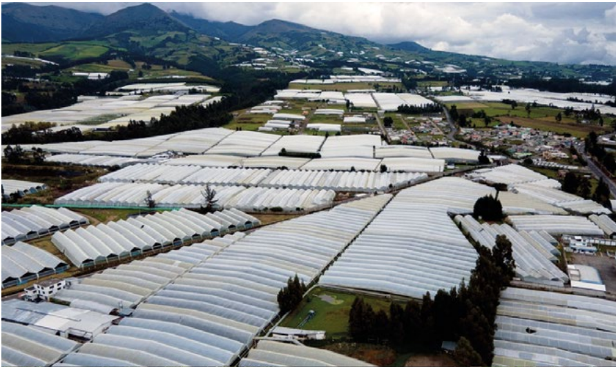
1.1 Invernaderos en el Cantón Pedro Moncayo. Pueblo Kayambi

Con las pequeñas floricultoras dentro de las comunidades se da deforestación para construir la plantación. La tala de árboles afecta a la