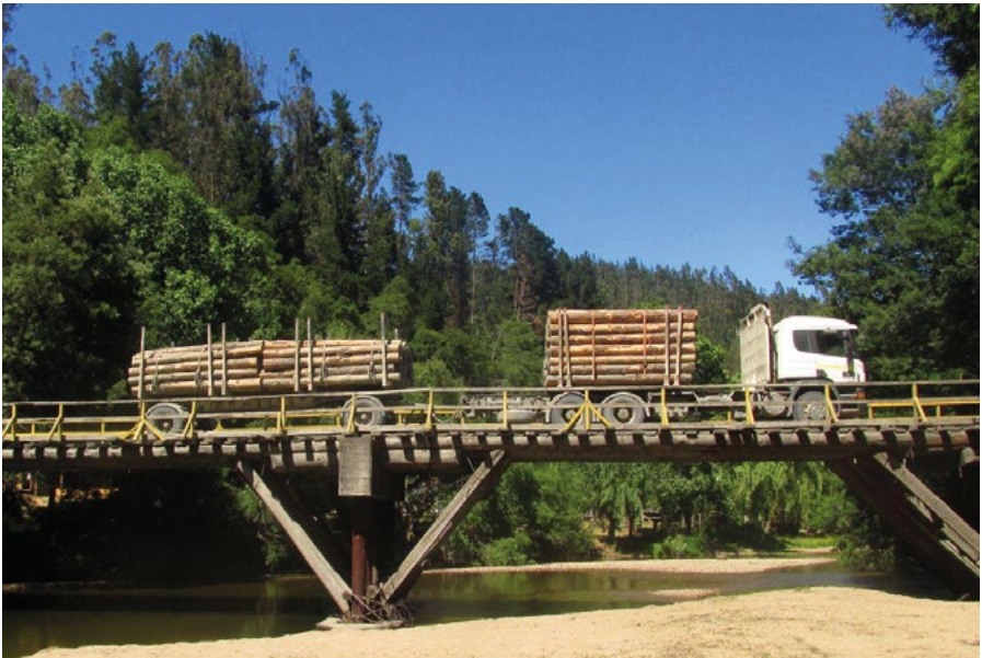
3.3 Movimiento de madera en el Sur de Chile

La zona sur de Chile conoció del monocultivo de pino y eucalipto a partir de los años 50, es decir, aproximadamente desde la década del 50 del siglo pasado. Este fenómeno se dio en el contexto de los intentos de industrializar el país, en un contexto marcado por el desconocimiento de los derechos del pueblo mapuche. Sin embargo, desde la dictadura cívico militar la situación se agudizó, particularmente por el Decreto Ley 701 de Fomento Forestal de 1974 (un año después del golpe de estado), que bonificaba la actividad forestal, asegurando las ganancias de los empresarios del rubro.