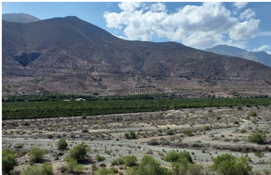
3.1 Monocultivo de palta en Petorca