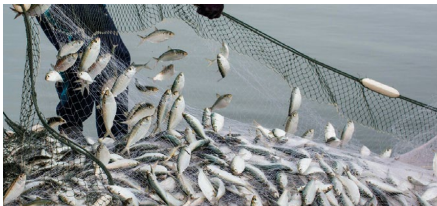
4.3 Pescando para la acuicultura

De la misma manera, se piensa que la cría de mariscos y otros productos del mar en granjas acuícolas pueden ser una respuesta a la sobre exportación de organismos marinos.