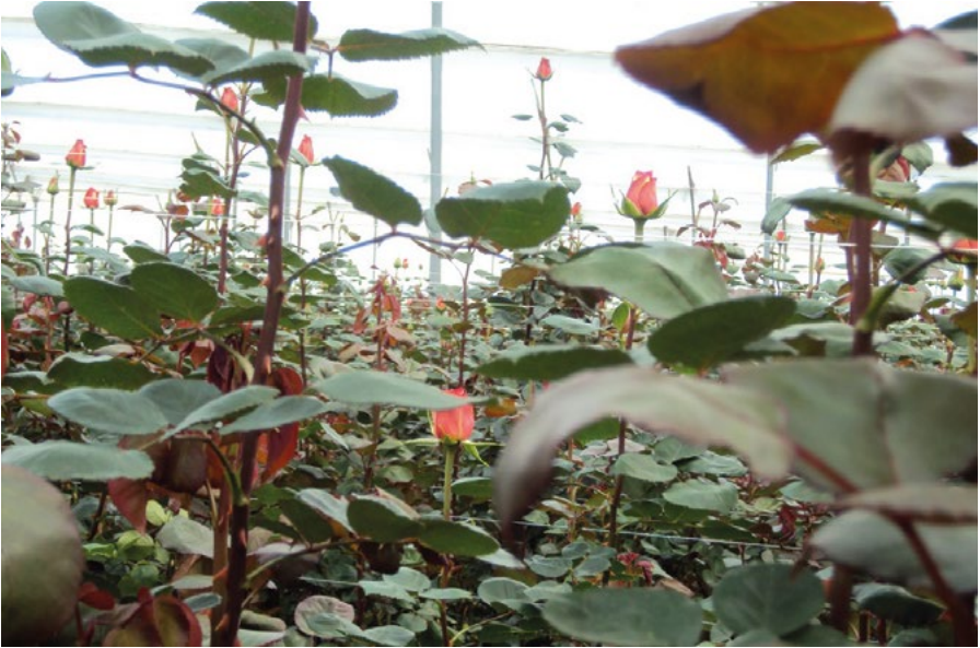
1.2 Cultivo de rosas