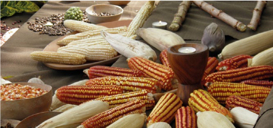
2.3 Semillas de Cotacachi

El cuidado de las semillas, su reproducción, conservación, circulación e intercambio es vital en la reproducción de la vida en todas las formas, colores y escalas que conocemos, sin ellas no hay existencia en la tierra. Este cuidado ha estado en manos de los y las campesinas quienes han domesticado la enorme variedad de especies vegetales que hoy nos alimentan. Gracias a sus prácticas y conocimientos, las semillas han podido adaptarse a diferentes condiciones ecológicas y culturales, proceso que se ha dado a lo largo de aproximadamente 10.000 años.