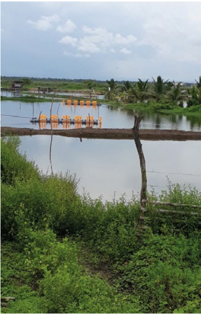
1.5 Camaronera en Humedal La Segua

El espacio que actualmente ocupa la piscina era un área de cría de ganado y cultivos agrícolas que estaban adaptados a los ciclos de sequía o inundaciones, propios de esta zona.